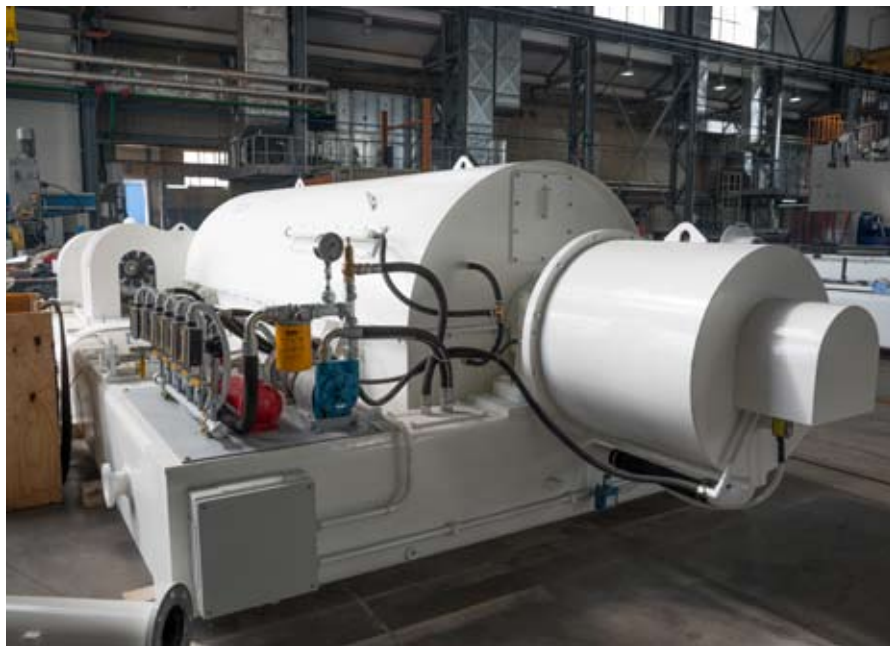
Рис. 1. Осадительно-фильтрующая центрифуга производства завода «ЭЛЕМЕТ»