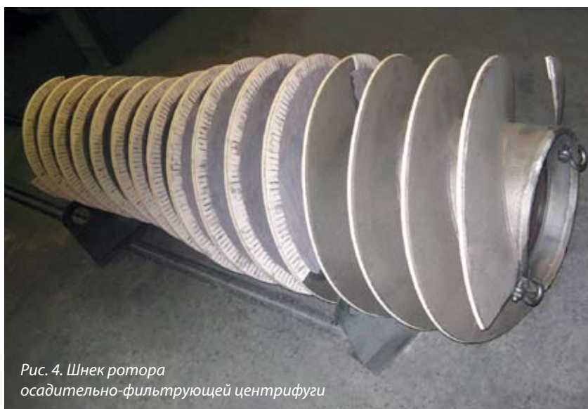
Рис. 4. Шнек ротора осадительно-фильтрующей центрифуги

Фильтрующая секция изготовлена с использованием специального карбид-вольфрамового шпальта. Все материалы имеют